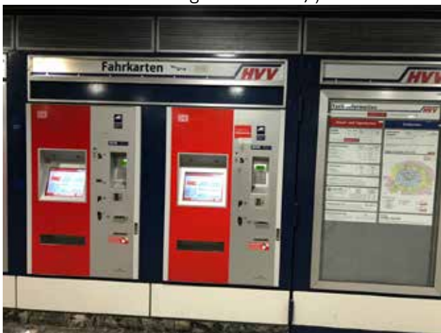
Zukunftsvision: Nahverkehr ohne Ticketschalter

Auch die Idee, zwei autofreie Sonntage im Monat einzulegen würde den CO-Ausstoß verringern helfen – und gleichzeitig Putins Kriegskasse schmälern ( www.linksfraktion-hamburg.de/hamburg-oelverbrauch-runter-und-zugleich-putins-kriegskasse-schmaelern-mit-zwei-autofreien-sonntagen-im-monat/ ).