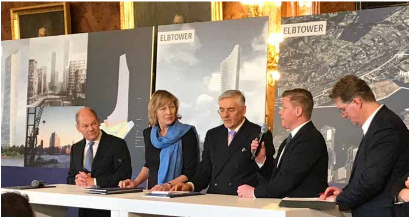
Kurz vor seinem Abgang nach Berlin kürt Olaf Scholz am 8. Februar 2018 den Wettbewerbssieger SIGNA mit seinem Elbtower

Für mich geht es bei der Akteneinsicht um solche Fragen wie: Wer wollte und will unbedingt den Olaf-Scholz-Gedenkturm haben? Weshalb wurde nicht der Höchstbietende ausgewählt? Weshalb klingeln keine Alarmglocken, wenn es um einen Investor wie René Benko geht, dessen Firmen im Steuerparadies Luxemburg sitzen, der in einem Steuerverfahren verurteilt wurde und gegen den laut »Der Spiegel« aktuell Ermittlungen wegen Bestechung laufen? Was ist mit der großartigen Publikumsnutzung, die immer wieder versprochen wurde? Wieso muss die 30-prozentige Vermietungsquote nicht direkt gegenüber dem Senat nachgewiesen? Wurde das EU-Beihilferecht missachtet?