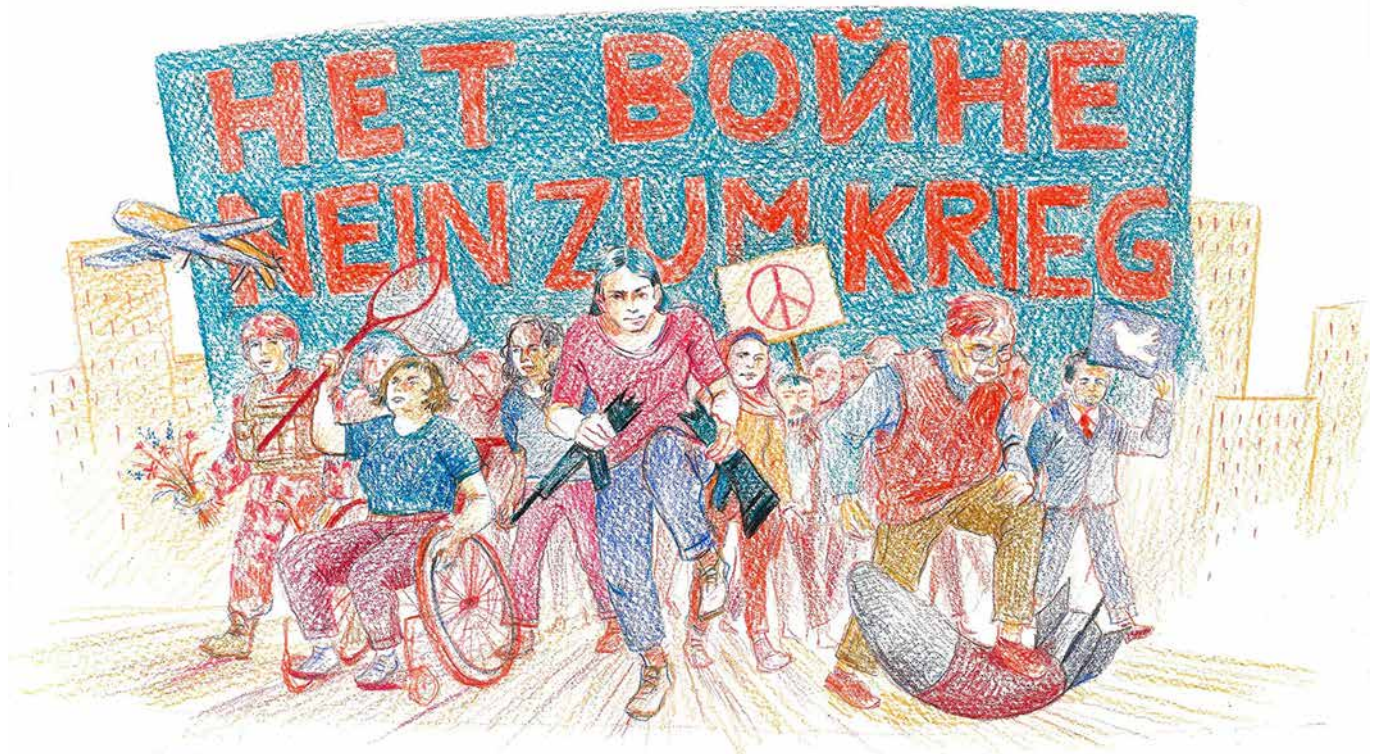
#derappell HET BOЙHE - Nein zum Krieg! www.derappell.de (vom 22.3.2022)

menpaket, das die größte Aufrüstung Deutschlands seit Ende des Zweiten Weltkriegs vorsieht. Eine massive Hochrüstung der Bundeswehr hilft den Menschen in der Ukraine nicht. Die neu anzuschaffenden Waffen werden die Ukrainer:innen in ihrem Kampf und Recht auf Selbstverteidigung nicht unterstützen. Schon jetzt übersteigen die »Verteidigungsausgaben« aller 30 NATO-Staaten die russischen um fast das Zwanzigfache. Die Anschaffung von konventionellen Waffen wie Kampfflugzeugen und bewaffnungsfähigen Drohnen als Abschreckung unter atomaren Militärblöcken ist sinnlos.