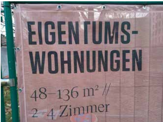
Überall neue Eigentumswohnungen, hier Werbung für ein Großprojekt an der Hamburger Straße

hat 2005 als erste deutsche Stadt eine Fachabteilung dafür gegründet. Jede dritte Wohnung in der Main-Metropole entsteht mittlerweile auf ehemaligen Büroflächen. Spitzenreiter des vergangenen Jahrzehnts war Berlin, auf das ein Drittel aller bundesweiten Umwandlungen entfiel. Wie ein Kurzgutachten der Arbeitsgemeinschaft für zeitgemäßes Bauen (ARGE) in Kiel gezeigt hat, rechnet sich das Umdenken: Die reinen Umbaukosten pro 3/4 Quadratmeter – abzüglich des Grundstücks- oder Rohbaupreises – liegen im Vergleich zum Neubau bei knapp 40 Prozent« ( https://email.t-online.de/em?wdycf=www.t-online.de#f=IN-BOX&m=11839851538777010&method=showReadmail ). Die H&K-Ausgaben werden zum Preis von 2,20 Euro von 530 Verkäufer:innen in ganz Hamburg angeboten.