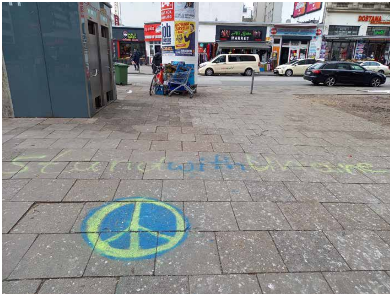
Friedensbekenntnisse wider die russische Intervention in der Ukraine

Putin dazu bewegen könnte, möglichst schnell in Friedensverhandlungen einzusteigen, die nicht die totale Zerstörung und/oder Übernahme der Ukraine zur Voraussetzung haben? Aus meiner Sicht lassen sich die Sinnhaftigkeit und der Wert von Solidaritätsaktionen, Sanktionen, Waffenlieferungen und NATO-Aufrüstung nur vor genau diesem Hintergrund beurteilen. Ein Versuch in zehn Thesen und einer Aufforderung: