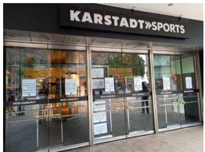
Leerstand seit mehr als anderthalb Jahren

stadt Sport « am Eingang der Mönckebergstraße ab demnächst für kreative Zwischennutzung zur Verfügung steht. Ganze, halbe oder viertel Geschosse von ca. 250 bis 1.200 Quadratmeter können von Juni/Juli bis Dezember 2022 angemietet werden. Der Eigenanteil der Raumkosten liegt monatlich bei 1,50 Euro je Quadratmeter, weiteres Geld kommt aus dem zurzeit noch bis Ende 2022 befristeten Förderprogramm »Frei Fläche: Raum für kreative Zwischennutzung«. Mehr Infos unter https://kreativgesellschaft.org/raum/frei_flaeche-raum-fur-kreative-zwischennutzung/ . Weitere Flächen, die unter diesem Förderprogramm rangieren, gibt es hier einzusehen: https://kreativgesellschaft.org/raum/frei_flaeche-die-plattform/ . Es lässt sich darüber spekulieren, was Stadt und Eigentümer:in mit diesem Schritt beabsichtigen, auf jeden Fall bietet die Zwischennutzung eine Chance, zu zeigen, was die Menschen in diesem Gebäude zukünftig gerne hätten.