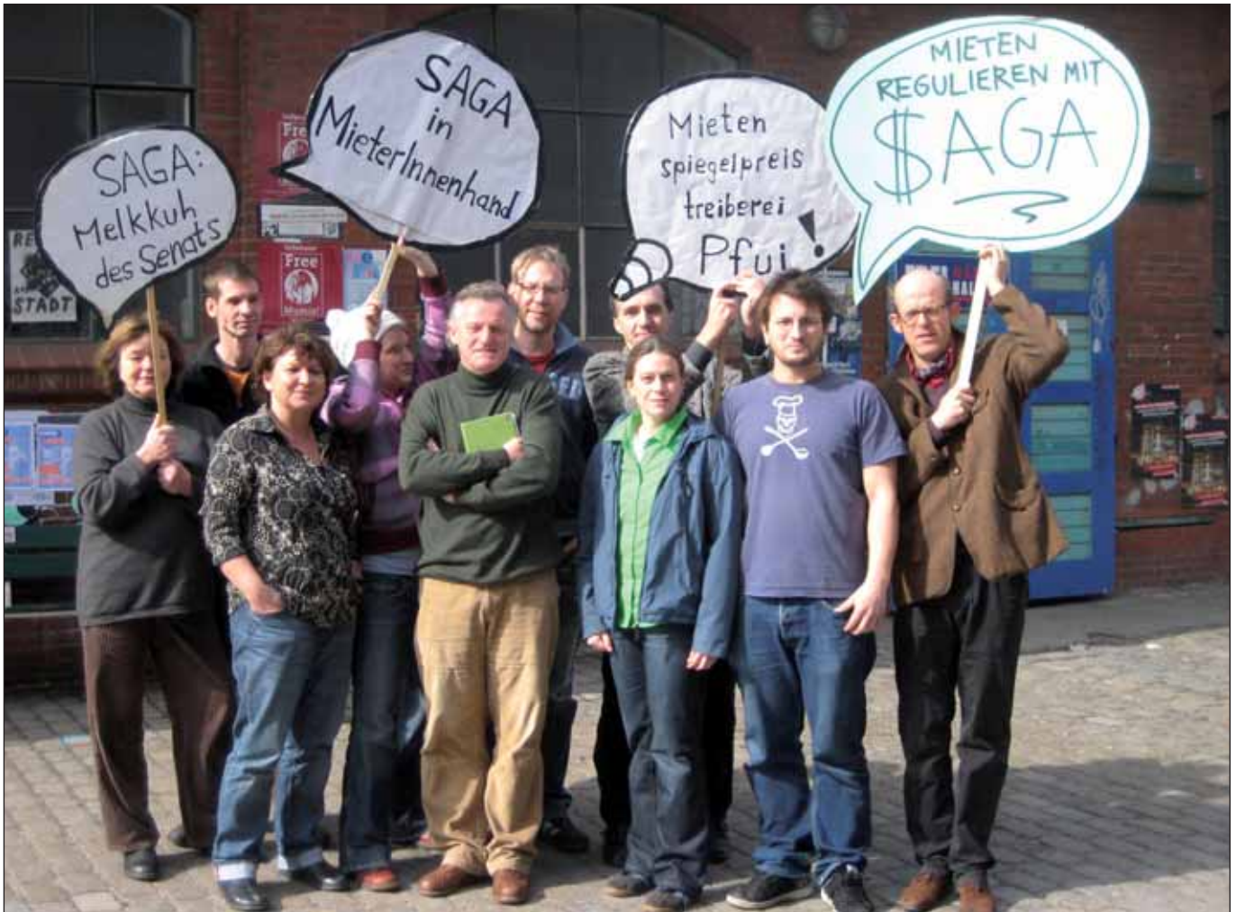
Aktiv für eine andere SAGA GWG - TeilnehmerInnen der RaSAG Mieten und Wohnen