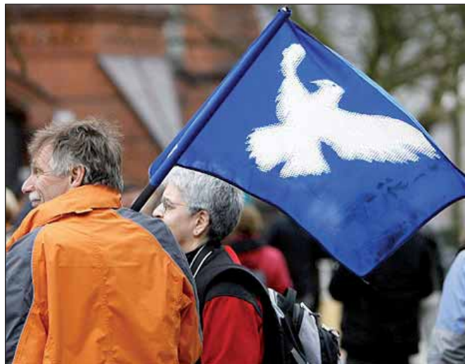
Hamburger Ostermarschierer 1960 und heute

Im April 1960, am damaligen Karfreitag, machten sich in Hamburg-Harburg rund 120 AktivistInnen zum ersten Ostermarsch der westdeutschen Geschichte auf. Damals ging es zum Truppenübungsplatz in Bergen-Hohne, um vor Ort gegen die dort stationierten Kurzstrecken-Atomraketen zu pro-