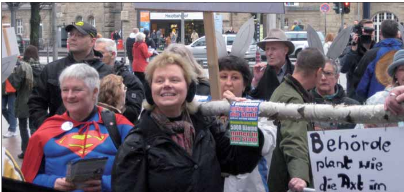
WilhelmsburgerInnen am Hauptbahnhof gegen Kahlschlagpolitik

Diese traurige Angabe machte der »Bund für Umwelt und Naturschutz Deutschland« (BUND) ausgerechnet für die Stadt, die sich anschickt, im kommenden Jahr Klimahauptstadt werden zu wollen. Alle Welt weiß, dass Bäume entscheidend sind für die CO 2 -Bilanz, und doch muss der Sprecher der Behörde für Stadtentwicklung und Umwelt (BSU), Björn Marzahn, in