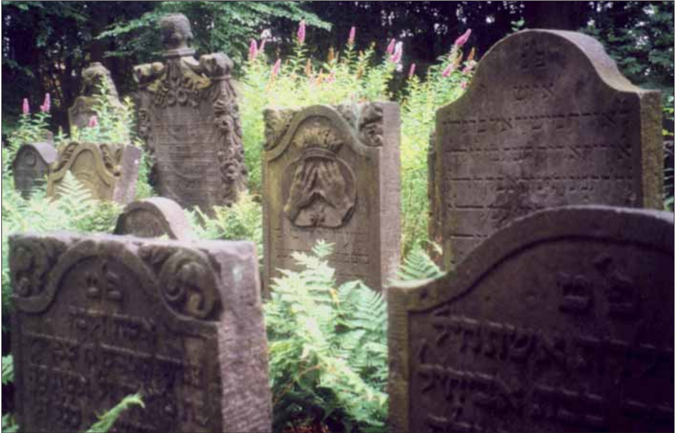
Friedhof Ilandkoppel

unterstelle ich dem Senat hinsichtlich des Zustandes und der Sicherung der alten Gräber des Jüdischen Friedhofes Ilandkoppel in Ohlsdorf. Der Jüdische Friedhof an der Ilandkoppel 68 ist einer der bedeutendsten Orte jüdischer Sepural- bzw. Begräbniskultur. Das elf Hektar große Areal wurde 1883 angelegt und hält die Erinnerung an bedeutende jüdische Persönlichkeiten aus der früheren Zeit wach, wurden doch im Gefolge der Schändung jüdischer Friedhöfe durch die Nazis eine Reihe von älteren Grabsteinen hierher versetzt. Auf dem Friedhof Ilandkoppel befindet sich das Grabmal des Vorkämpfers für die jüdische Emanzipation Gabriel Riesser (1806-1863) und das von Betty Heine (1771-1859), der Mutter von Heinrich Heine. Die ältesten Grabmale datieren aus dem Jahre 1713. Nach 1945 wurden auf dem Friedhof – als übrigens dem einzigen in Hamburg – auch wieder Hamburger Jüdinnen und Juden bestattet. Seit 1951 befindet sich auf dem Gelände das zentrale Mahnmal für die während der NS-Zeit ermordeten Hamburger Juden.