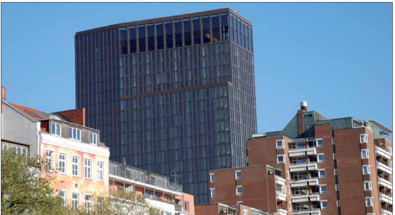
Blick hinauf: Empire-Riverside-Hotel in St. Pauli

Nur 1.185,- (eintausendeinhundertfünfundachtzig!) Euro kostete der Eintritt zum »Immobilien-Symposium Hamburg 2010«, das das Hamburger Abendblatt am 9./10. Februar im feinen Empire-Riverside-Hotel in St. Pauli durchführte. Der Ort war nicht schlecht gewählt, hätten Menschen aus Sozialwohnungen, benachteiligten Vierteln des Hamburger Ostens,