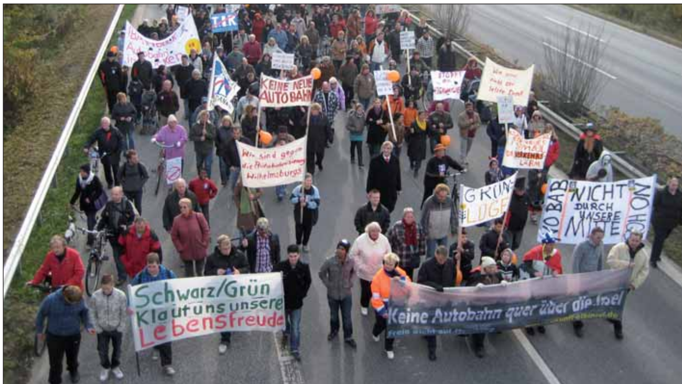
WilhelmsburgerInnen in Bewegung

zirkpolitikerInnen in Mitte und Harburg blieb gerade mal bis zum 12. Februar Zeit, dazu Stellung zu nehmen!