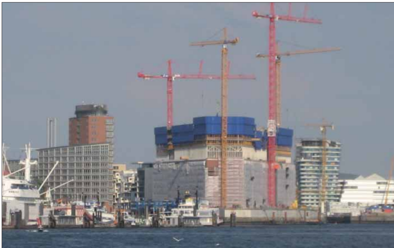
Die explodierende Elbphilharmonie

Am 10. Februar stand in der Bürgerschaft auf Antrag der SPD-Fraktion das Thema »Explodierende Kosten bei städtischen Baumaßnahmen« auf der Tagesordnung.