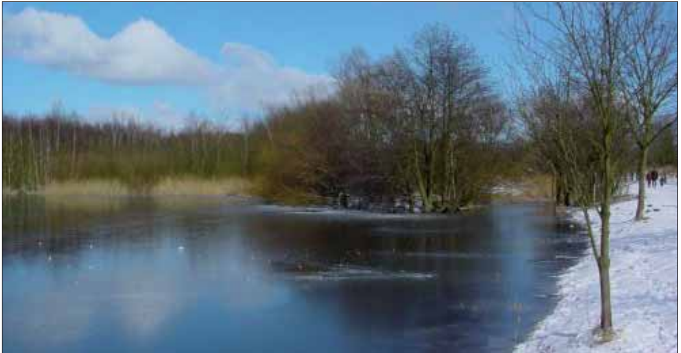
Glinde Au speist die Ökokraft der Bille

Verschiedene Vorgänge um die Beseitigung und Neugestaltung von Grünflächen in Hamburg-Mitte berühren auch einige grundsätzliche Fragen zur Stadtentwicklung im Rahmen der »Wachsenden Stadt«. Städtische Grünflächen, die im Bezirk Mitte etwa 600 ha mit 400 ha reinen Parkanlagen einnehmen, erfüllen wichtige ökologische und soziale Funktionen.