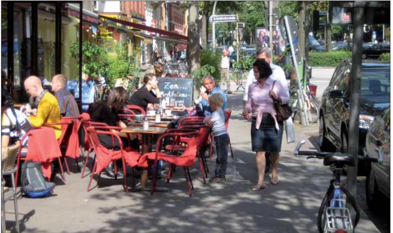
Lange Reihe shared spaced?

Im Koalitionsvertrag von CDU und GAL ist vor zwei Jahren fixiert worden, dass in jedem Bezirk eine Straße als Shared-Space-Zone ausgewiesen wird. Nach mehr oder weniger ergebnislos gebliebenen Schriftlichen Kleinen Anfragen hat sich jetzt der Senat erstmals zu den vorgeschlagenen bzw. geprüften Straßen(abschnitten) geäußert. Unterlagen sind für folgende (z.T. bisher überhaupt noch nicht öffentlich erörterte) Straßenräume zur weiteren Prüfung bei der Behörde für Stadtentwicklung und Umwelt (BSU) eingereicht worden: