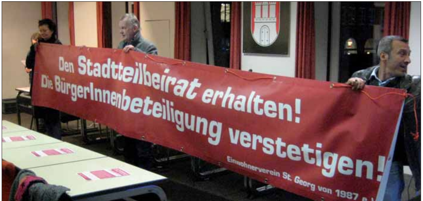
Protest in der Bezirksversammlung Mitte, 20.11.2014