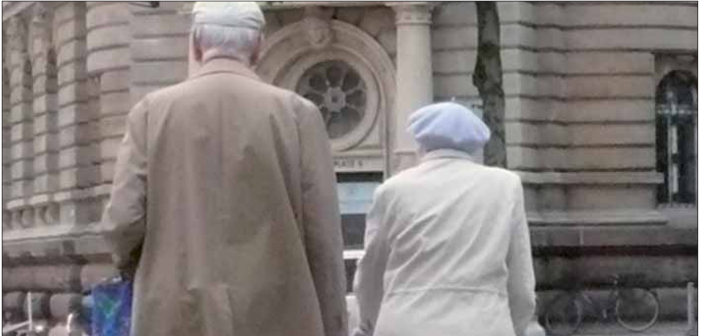
Senioren in »guter Mittellage«? (C. Hannen)

In Hamburg kommen Öffentlichkeit und Politik immer weniger am Thema Armut vorbei. Besonders im Blickpunkt: die ältere Bevölkerung. Die Faktenlage ist einfach. Es gibt viele Gesichter der Armut in der Stadt: Obdach- und Wohnungslose, Flüchtlinge und viele BürgerInnen, die sich über die Tafeln über die Runden bringen. Unstrittig ist: In Hamburg ist die Altersarmut ein immer drückender werdendes Problem. Erfasst sind mehr als 22.000 SeniorInnen, die von Grundsicherung leben. Das sind 6,8% der älteren Bevölkerung über 65 Jahren dieser Stadt. Der Anteil ist nirgends so hoch, auch die anderen Stadtstaaten schneiden besser ab. Deshalb ist Hamburg in den Medien zur Hauptstadt der Altersarmut ausgerufen worden.