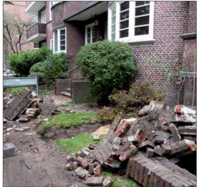
Zerstörtes Backstein-Erbe

»Rettet Elisa!« – dieser Ruf geht nun schon seit drei Jahren durch die Stadt. Mit allen Mitteln versucht die »Vereinigte Hamburger Wohnungsgenossenschaft« (vhw) die MieterInnen aus dem Gebäudekomplex am Elisabethgehölz in Hamm zu verdrängen, um hier einen lukrativeren Neubau zu errichten. Der Widerstand gegen den Abriss ist auf den entschlossenen Widerstand vieler BewohnerInnen und ihrer Initiative »Rettet-Elisa!«, aber auch einer breiten Öffentlichkeit gestoßen. DIE LINKE unterstützt diesen Protest seit Anbeginn und vertritt die Position, dass Sanierung vor Abriss geht und eine Zerstörung von günstigem Wohnraum in Zeiten der Wohnungsnot – allemal bei einer Genossenschaft – ein absolutes No-Go ist. Wir danken der MieterInnen-Initiative für die Verfassung des nachfolgenden Artikels. Mehr zum dreijährigen Kampf der Initiative unter www.rettet-elisa.de .