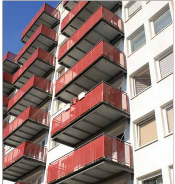
Wohnhaus in Horn (C. Hannen)

■ Das Gesetz soll laut Einzelentscheidung der Kommunen nur in »Gebieten mit angespanntem Wohnungsmarkt« zur Anwendung kommen. Die Hamburger SPD hat zwar angekündigt, das Gesetz flächendeckend auf die ganze Stadt anzuwenden, trifft damit aber – wie schon bei der Kapplungsgrenzenreform mit einer ähnlichen Regelung – auf den Widerstand des hiesigen Grundeigentümergebietes