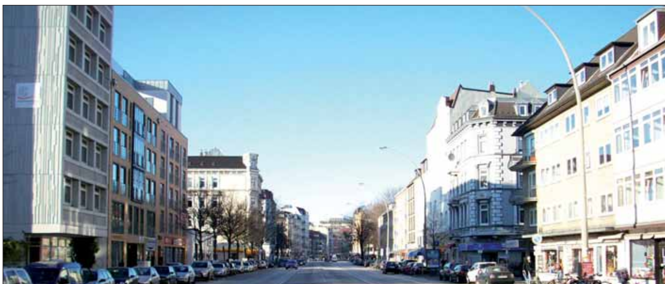
Rosige Zeiten für MieterInnen? Grindelallee

In den verbleibenden gut zweieinhalb Monaten bis zur Bürgerschaftswahl am 15. Februar 2015 werden die HamburgenInnen von Senats- und SPD-Seite (nicht nur) in wohnungspolitischer Hinsicht regelmäßig mit der Parole »Versprochen und gehalten!« bepfastert werden. Und, ja, tatsächlich ist das »Versprechen« von 6.000 neu errichteten Wohnungen im vergangenen Jahr umgesetzt worden, 6.407 neue Wohneinheiten sind fast das Doppelte dessen, was der schwarz-grüne Vorgänger-Senat zustande gebracht hatte. Auch wenn von der Zahl die 345 Abrisse abzuziehen sind, bleibt doch die 6.000 (genau 6.062) stehen.