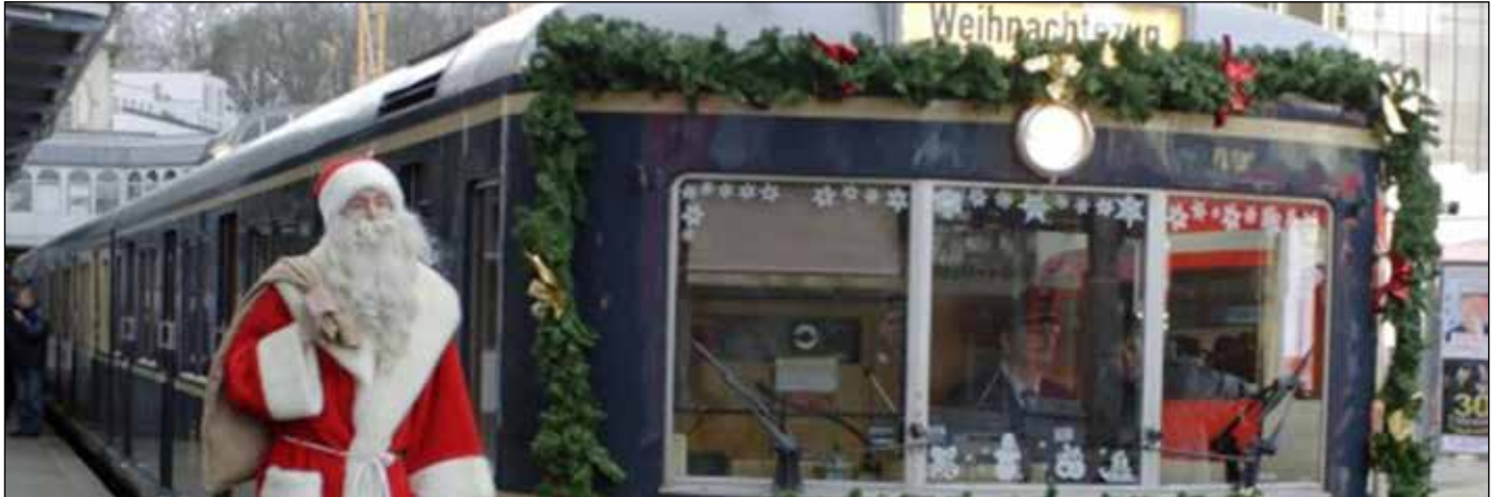
Keine Geschenke vom HVV..