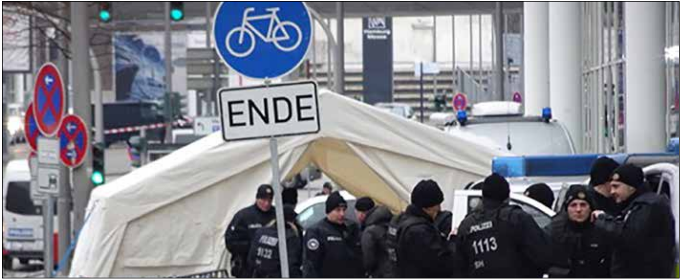
Checkpoint an der Grenze der Sicherheitszone (C. Schneider)

Auch wenn eine Tagung der Organisation für Sicherheit und Zusammenarbeit in Europa (OSZE) sicher differenzierter zu bewerten ist als eine Konferenz des G20-Gipfels der 20 reichsten, ökonomisch, politisch und militärisch stärksten 20 Staaten der Welt, so war erstere am 8./9. Dezember 2016 ein bitterer Vorgeschmack auf zweitere am 7./8. Juli 2017. »Austragungsort« für beide Veranstaltungen: Hamburg. Zielsetzung unter sicherheitsrelevanter Perspektive: Im Dezember 2016 schon mal erproben und veranschaulichen, was uns im Juli 2017 voraussichtlich in noch geballterer Form erwarten dürfte: Ein nochmals getoppter größter Polizeieinsatz in der Geschichte der Freien und Hansestadt. Zum »Schutz« der OSZE-Tagung vor einigen kleineren Aktionen und Demonstrationen sind in Hamburg u.a. aufgefahren worden: 13.200 PolizistInnen, 18 Panzerwagen, 22 Wasserwerfer, 35 Boote, 10 Hubschrauber, 62 Hunde, 37 Polizeipferde ( http://www.mopo.de/25205726 ).