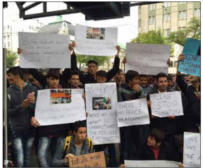
Protest afghanischer Geflüchteter, 7.11.2015

Und das Schlimme: Hamburg hätte nicht mitmachen müssen. Unsere Nachbarländer haben sich verweigert. Doch auch hier beansprucht Hamburg eine Vorreiterrolle. Ich habe in den letzten Tagen den Eindruck von einer Ausländerbehörde gewonnen, die vor Eifer, möglichst viele Menschen in den Flieger zu schicken, völlig außer Rand und Band geraten schien. Die bei ihrem Übereifer auch etliche weitere Rechtsbrüche oder rechtlich fragwürdige Maßnahmen in Kauf nimmt. Zum Beispiel Inhaftierungen ohne richterlichen Beschluss oder