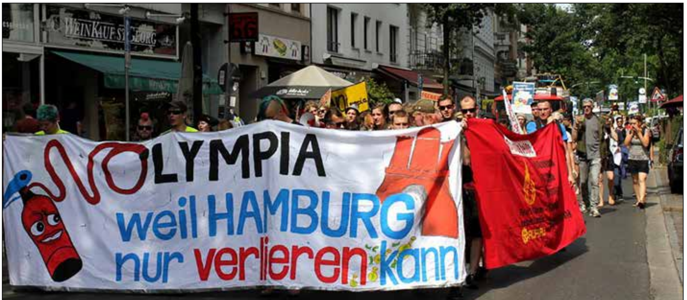
Demo in der Langen Reihe (www.mittendrin.de)

Bilanz der Initiative NOlympia Hamburg zum Jahrestag des Referendums