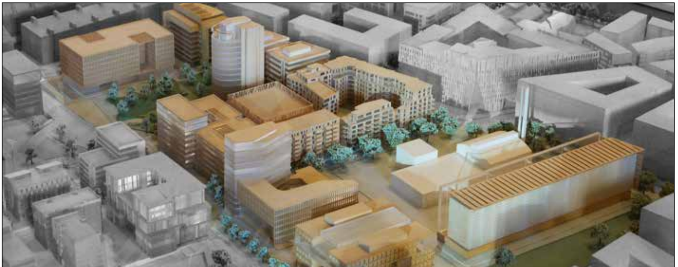
Modell des Quartiers Am Sandtorpark, Hafencity

Seit fünf Jahren ist die Wohnungspolitik ein Schwerpunkt des SPD-geführten Senats. Doch der Mietenwahnsinn und die Wohnungsnot für Menschen mit wenig Einkommen sind auch heute ungebrochen.