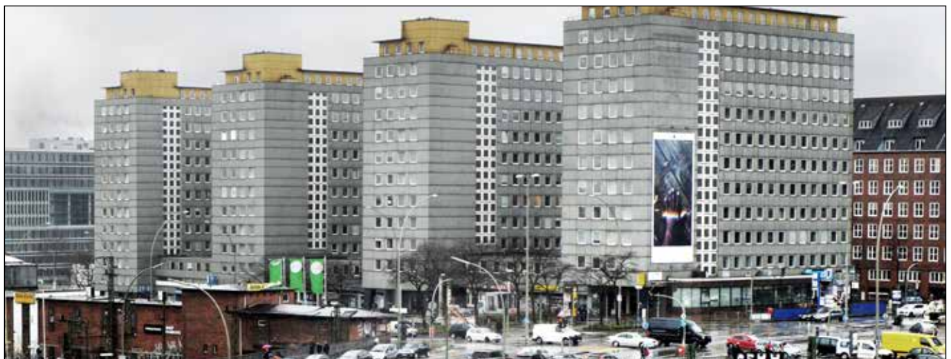
Cityhöfe 2015

Eigentlich schien- trotz aller knirschenden Widersprüche – alles in trockenen Tüchern: Kulturbehörde und Denkmalschutzamt wurden ruhiggestellt, ein Wettbewerbsverfahren zur Neugestaltung ausgerichtet, die Öffentlichkeit auf so etwas wie »alternativlos« orientiert. Aber nein, weit gefehlt!