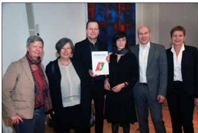
Koalitionsvertrag r2g